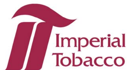
Firmenlogo Imperial Tobacco Group

Die Imperial Tobacco Group ist das viertgrößte Tabakunternehmen der Welt, mit Hauptsitz in Bristol, Großbritannien. Die ITG verkauft ihre Produkte in über 130 Ländern der Welt und beschäftigt rund 15.000 Mitarbeiter.