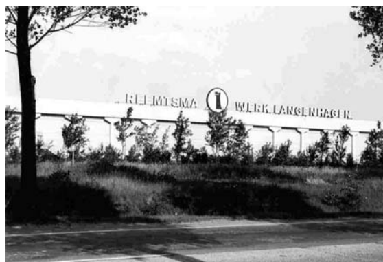
Reemtsma-Werk in Langenhagen bei Hannover, kurz nach der Eröffnung 1971