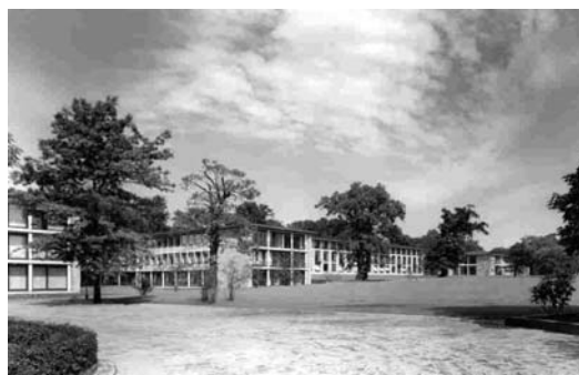
Parkstraße Hamburg: Von Anfang der 50er Jahre bis 2004 Sitz der Reemtsma-Hauptverwaltung