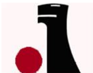
Reemtsma Logo 1920