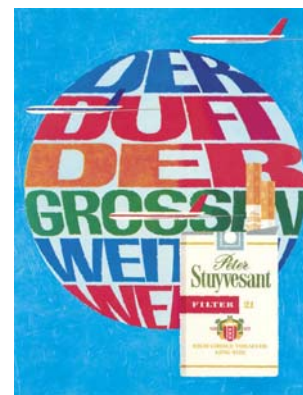
Frühes Werbeplakat Peter Stuyvesant